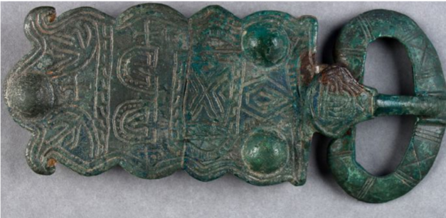
exemple plaque-boucle complète

État de conservation : seul le bout sur lequel se posait l'ardillon nous est parvenu aujourd'hui. À l'origine, cette boucle appartenait à une plaque-boucle (cf. exemple ci-dessous) qui n'a pas été retrouvée et qui servait à accrocher la boucle à la ceinture elle-même.